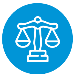
Normen en waarden

Het doel van Ballast Nedam is om de waarden en normen, kernwaarden en verplichtingen met onze bedrijfsethiek en de gedragscode reglementen uiteen te zetten. Bij het uitvoeren van onze activiteiten handelen we altijd in overeenstemming met onze normen en waarden en kernwaarden.